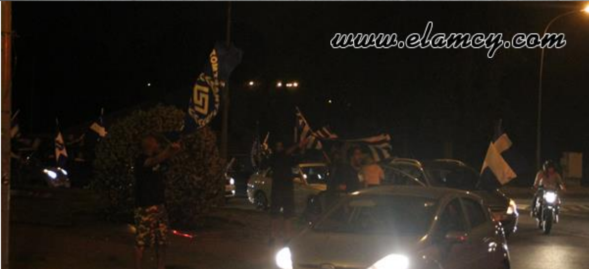
Πανηγυρισμοί ΕΛΑΜιτών για την εκλογή της νέο-ναζιστικής Χρυσής Αυγής στο Ελληνικό κοινοβούλιο, Μάης 2012.